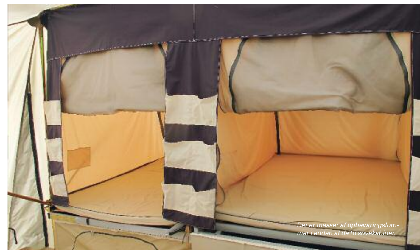
Der er masser af opbevaringslommer i enden af de to sovekabiner.