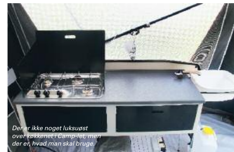
Der er ikke noget luksuøst over køkkenet i Camp-let, men der er, hvad man skal bruge.

Der er lommer til opbevaring i begge sider af de to senge, derudover er der 10 opbevaringslommer i fodenden af sengene. Det er muligt at trække vinduerne ud mod sovekabinen ud, så