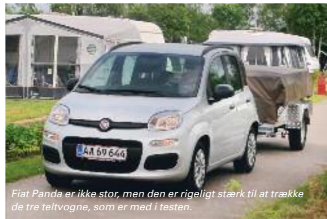
Fiat Panda er ikke stor, men den er rigeligt stærk til at trække de tre teltvogne, som er med i testen.

Noget af det geniale ved teltvognene er, at de kan trækkes af selv helt små biler. Til testen havde vi fået lov at låne en Fiat Panda TwinAir 65 PopStar, der har en koblingsvægt på 800 kg, og således uden problemer kan trække de tre teltvogne. Fiat Panda var også med i kampen om at blive Årets Campingtrækker 2014, hvor den overraskede testholdet ved at være en sjov og kvik vogn at køre. Det udløste således anerkendelsen "Stærk med træk". ■