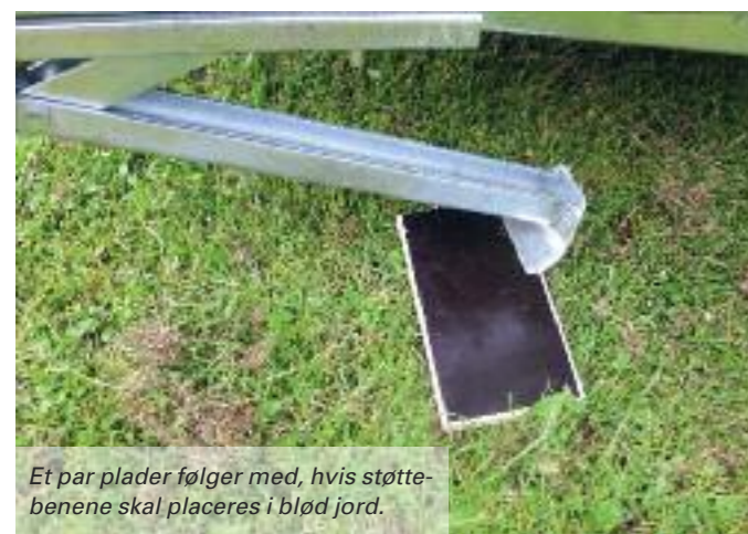
Et par plader følger med, hvis støttebenene skal placeres i blød jord.