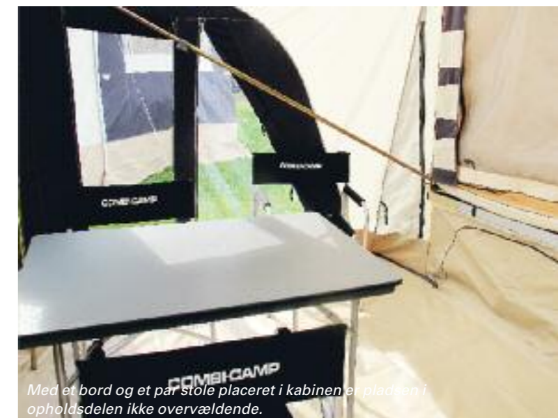
Med et bord og et par stole placeret i kabinen er pladsen i opholdsdelen ikke overvældende.

Fra gulvet og op til sengene er der temmelig højt, så er benene korte, kan det give god mening at investere i en lille skammel.