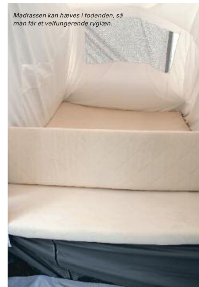
Madrassen kan hæves i fodenden, så man får et velfungerende ryglæn.

Under den ene seng kan man lyne en kraftig og tæt plasticsæk på, som kan bruges til opbevaring af madvarer, der ikke behøver komme på køl, eller tøj, som kan ligge tørt og godt på dette sted. →