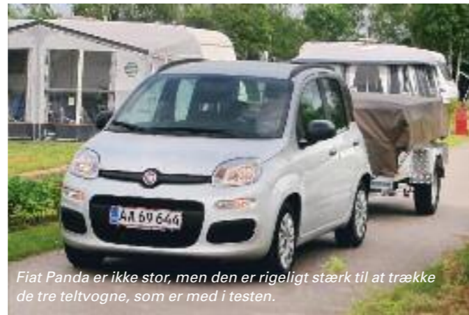
Fiat Panda er ikke stor, men den er rigeligt stærk til at trække de tre teltvogne, som er med i testen.

Noget af det geniale ved teltvognene er, at de kan trækkes af selv helt små biler. Til testen havde vi fået lov at låne en Fiat Panda TwinAir 65 PopStar, der har en koblingsvægt på 800 kg, og således uden problemer kan trække de tre teltvogne. Fiat Panda var også med i kampen om at blive Årets Campingtrækker 2014, hvor den overraskede testholdet ved at være en sjov og kvik vogn at køre. Det udløste således anerkendelsen "Stærk med træk". ■