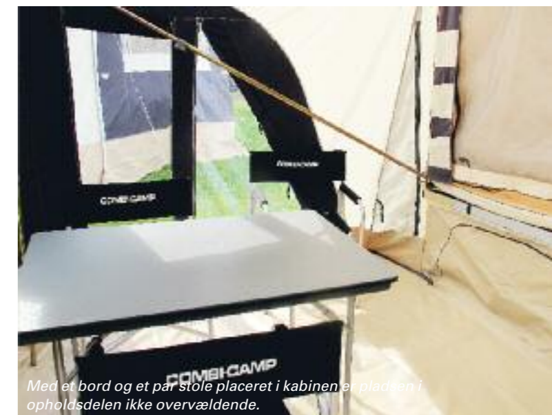
Med et bord og et par stole placeret i kabinen er pladsen i opholdsdelen ikke overvældende.

Fra gulvet og op til sengene er der temmelig højt, så er benene korte, kan det give god mening at investere i en lille skammel.