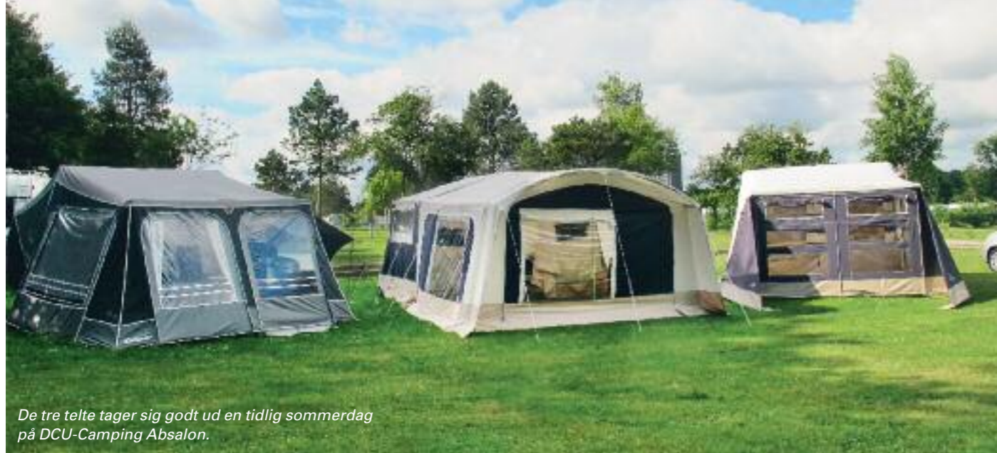
De tre telte tager sig godt ud en tidlig sommerdag på DCU-Camping Absalon.