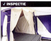
✓ INSPECTIE Het opklapbare bed verkeert in prima conditie

Deze Combi-Camp Venezia is uitgerust met een opklapbare lattenbodem van 160 cm breed